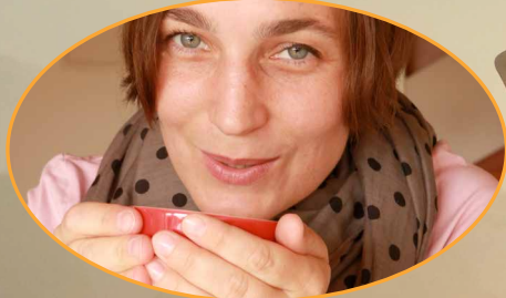
Patientin trinkt Dekott