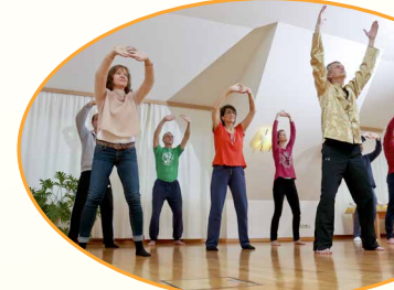
QiGong in der Gruppe