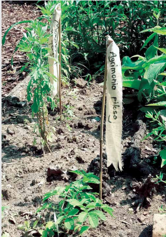
Fahnen für die chinesischen Heilpflanzen im Klinikgarten

Rohdrogen, so der korrekte Apotheker-Ausdruck für die chinesischen Heilkräuter, lernen unsere Patienten normalerweise als getrocknete Ingredienzien der Rezepturmischung kennen, die ihnen die Ärzte nach kundiger Diagnose verschreiben. Oder, falls die Rezepturen schon abgekocht ausge-